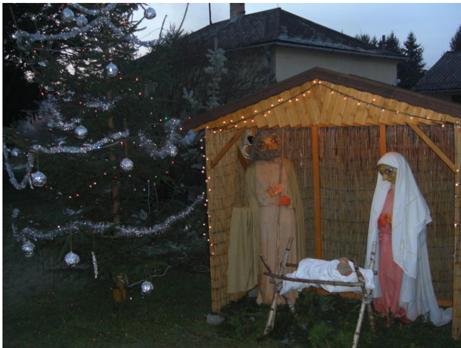
Obr. 3 – Rozsvícení vánočního stromu