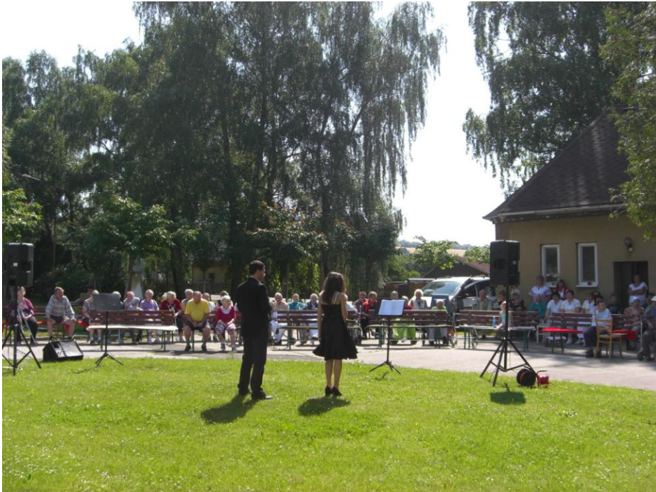
Obr. 1 - Divadlo Slunečnice Brno – písně W. Matušky