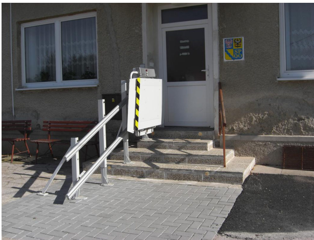
Obr. č. 4 – zdvižná plošina Logic